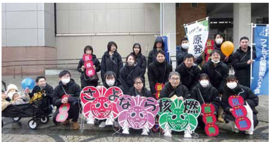
雨の中デモを行いました