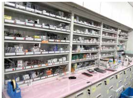
柔らかな色合いの薬品棚