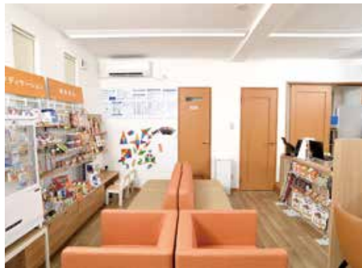
お子様連れでも安心の待合スペース