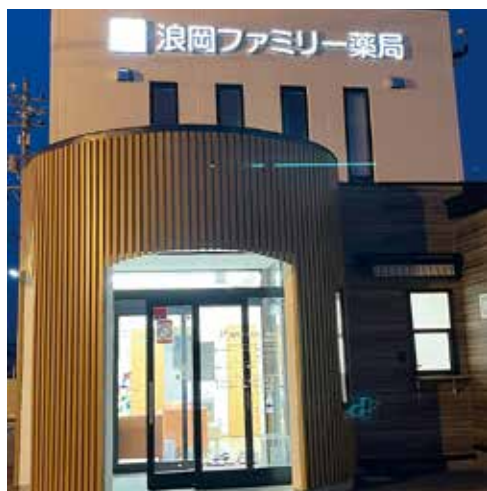
夜間は明かりがついてオシャレ