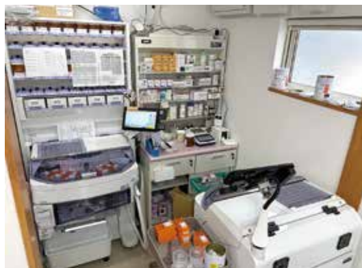
頼れる相棒 散薬分包機