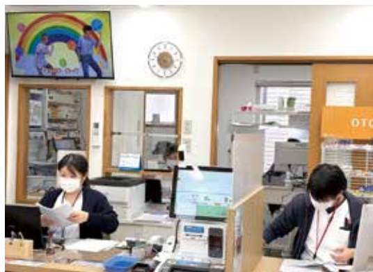
薬剤師も事務もフル稼働