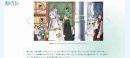
(公式WEBサイトより引用)

だから私は、この作品は決して“子ども向けアニメ”ではなく、むしろ大人こそ見るべき作品だと感じています。忙しい毎日の中で、今そばにいる人との時間を大切にしたい—そう思わせてくれる作品です。