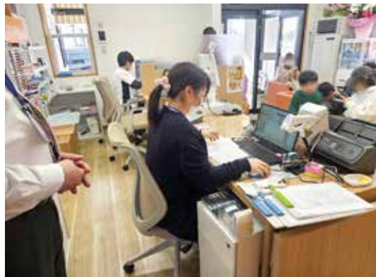
忙しい時間帯もチームで丁寧に