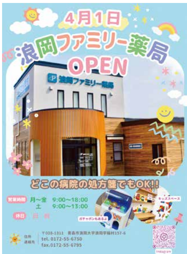
浪岡エリアに配布したOPENチラシ