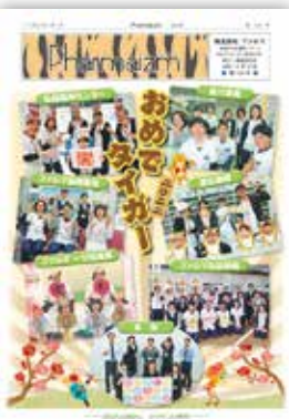
各薬局のご協力のおかげで写真賞いただきました

2022年新年号も『2022全国新年号機関紙コンクール』に応募しました。5回目の応募です。今回は「チャレンジタイガー」の企画や各薬局総動員の写真やメッセージボードを使い、一貫した演出で明るい紙面に作りあげていましたと講評いただき、昨年の審査委員特別賞より上の写真賞を受賞しました。