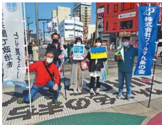
晴天の中でパレード

4月30日(土) 弘前駅前りんご広場で「憲法9条守れ、戦争法廃止！集会とパレード」が開催されました。晴天の中ファルマからは6名が参加し、戦争する国づくりへの反対や力の論理は決して平和をもたらさないと訴えました。