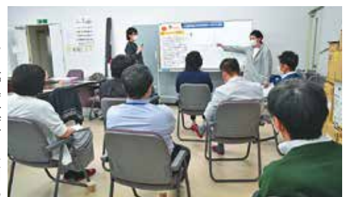
白熱中のホワイトボードミーティング