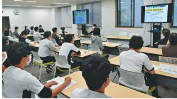
ほぼ全員の正職員が参加しました

まだ厳しい状況であることを確認しました。処方せん枚数が減少傾向にある中で、私たちにないが、できるのかを本気で考えなければならぬと感じています。これまで新しいことにどんどん挑戦してきたファルマだからこそ、コロナ禍で厳しい経営状況であっても乗り越えられたのだと実感しています。新たな壁にぶち当たっても、これまでのように薬剤師・事務が一緒になって取り組んでいけば、乗り越えていける力が私たちにあります。と信じています。